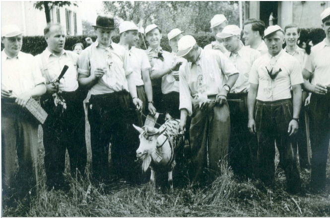
Schützenfest 1957: Der Jahrgang 1926/27 führt beim Montags-Festzug eine bemalte Ziege mit.

Ältere werden sich sicher noch erinnern an den „großen Erntedankfestzug“ in Voßwinkel 1958 und mit Heinz Kröger mit dem Esel oder an das Schützenfest 1957, als die 30jährigen eine bemalte Ziege im Festzug mitführten, die dann - so munkelt man - Schützenfestdienstag geschlachtet und „verspeist“ wurde.