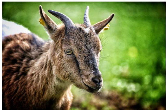
Beim Bock tun, auf etwas Bock haben, den Bock zum Gärtner machen ... Um den Ziegenbock gibt es viele Redensarten