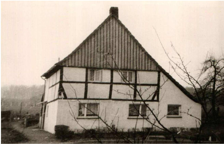
Die Ziegenbockstation im Haus Kröger, damals Bundesstraße 64

So wird die Gemeindevertretung Voßwinkel am 8. März 1966 davon